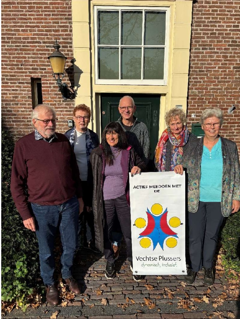
Bestuur per 5/11/2024